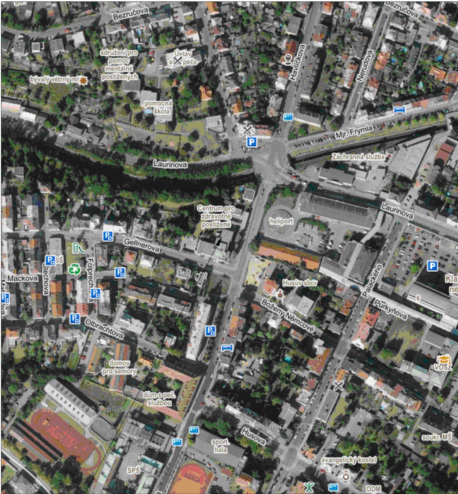
Centrum 83, poskytovatel sociálních služeb, Havlíčková 447/13, 293 01 Mladá Boleslav